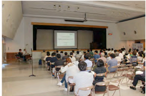
公開シンポジウム