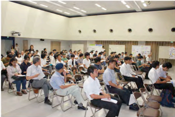
公開シンポジウム