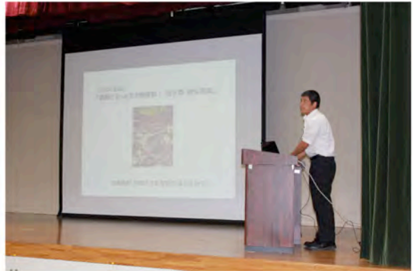
公開シンポジウム