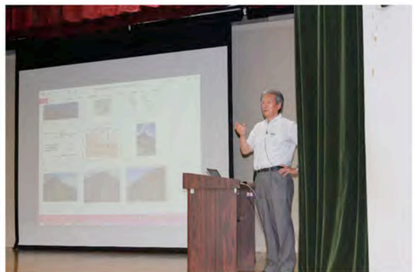
公開シンポジウム