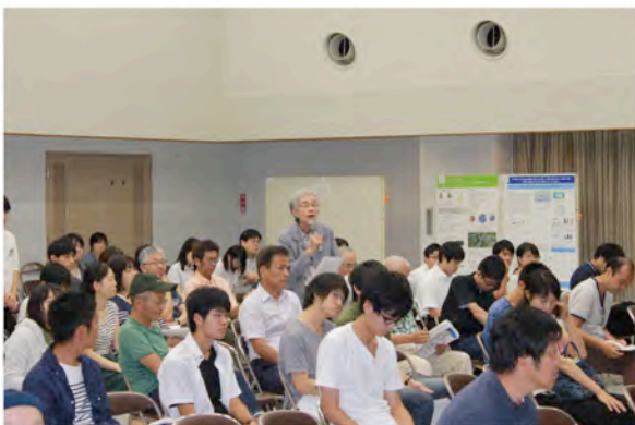
公開シンポジウム