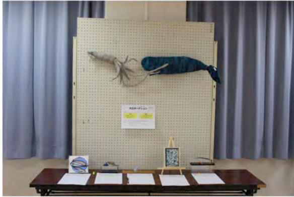
生物部のオークション