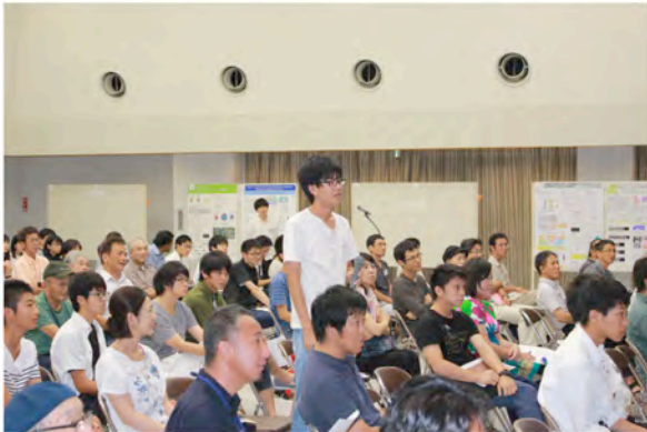
公開シンポジウム