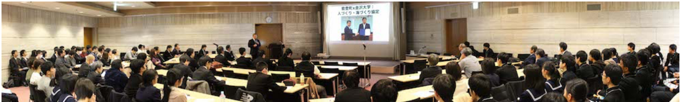
公開シンポジウム