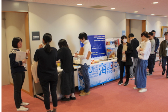
海と日本プロジェクト PR コーナー