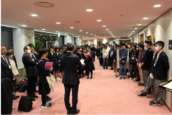
高校生ポスター表彰式